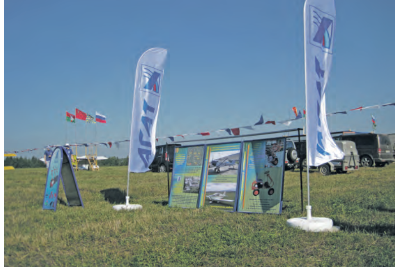
Выставка завода "Агат".

Полезное и востребованное мероприятие в рамках дня города организовала общероссийская общественная организация