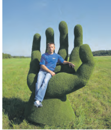
Наш товарищ на травяной ладони.

коврика и просто отдыхали, благо погода выдалась замечательной. А видимо, особо уставшие от офисной жизни даже лежали и дремали в теничке.